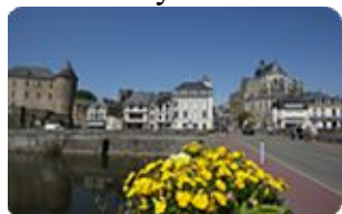
Ancienne cité ducale