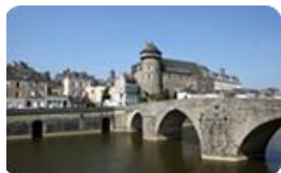
Ville d'Art et d'Histoire