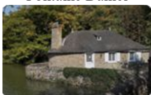
Les célèbres Toiles de Mayenne

Mayenne-tourisme.Villes-et-villages-de-caractere