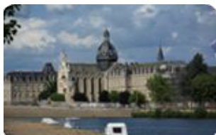
Cité millénaire, Plus beau détour de France

Mayenne - Ancienne cité ducale Fontaine Daniel - Les célèbres Toiles de Mayenne